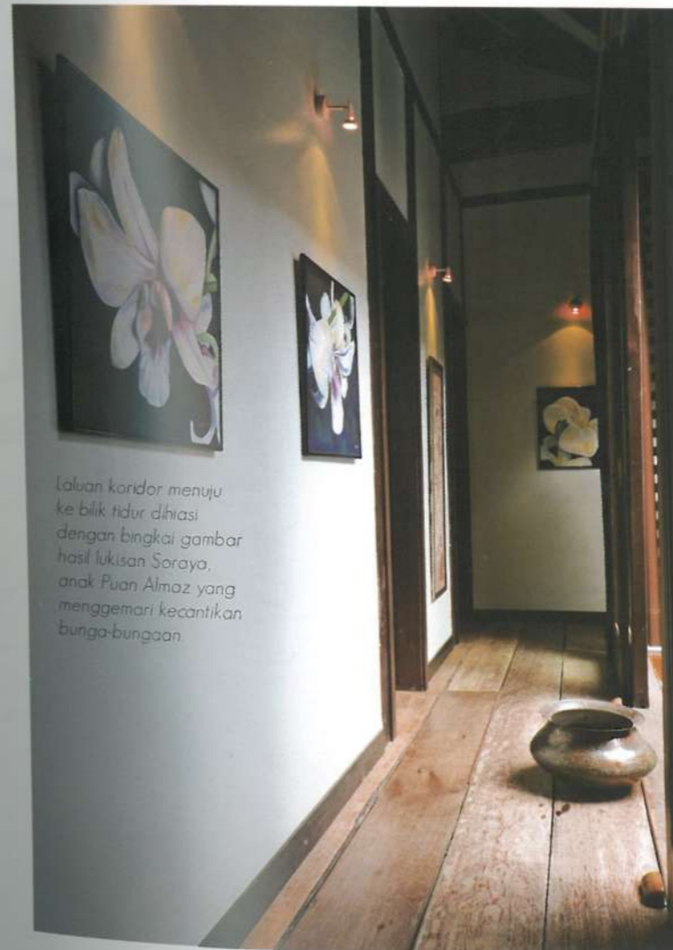
Laluan koridor menuju ke bilik tidur, dihiasi dengan bingkai gambar hasil lukisan Soraya, anak Puan Almaz yang menggemari kecantikan bunga-bunga.