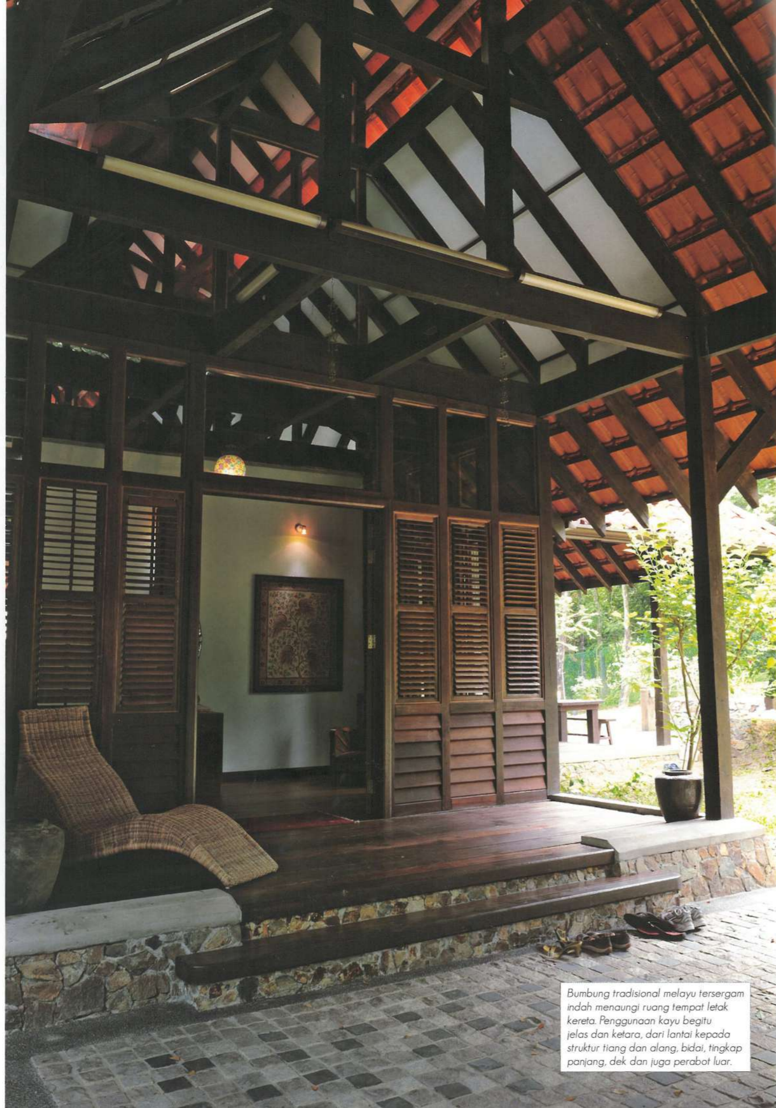
Bumbung tradisional melayu tersergam indah menaungi ruang tempat letak kereta. Penggunaan kayu begitu jelas dan ketara, dari lantai kepada struktur tiang dan alang, bidai, tingkap panjang, dek dan juga perabot luar.