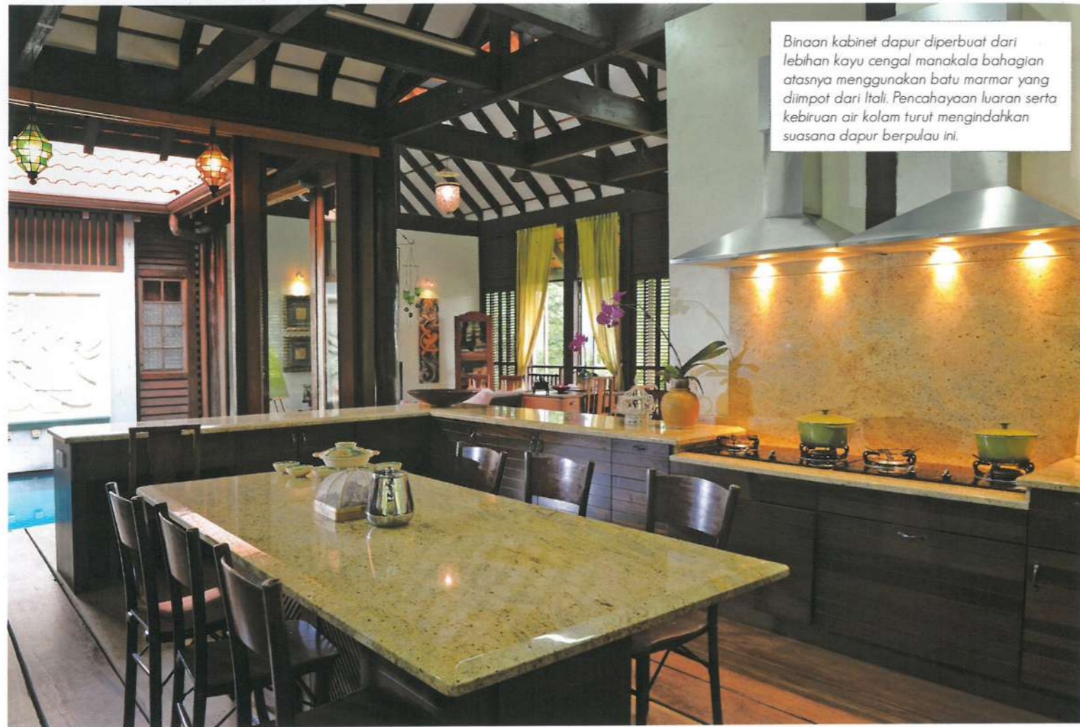
Binaan kabinet dapur diperbuat dari lebihan kayu cengal manakala bahagian atasnya menggunakan batu marmor yang diimport dari Itali. Pencahayaan luaran serta kebiruan air kolam turut mengindahkan suasana dapur berpulau ini.