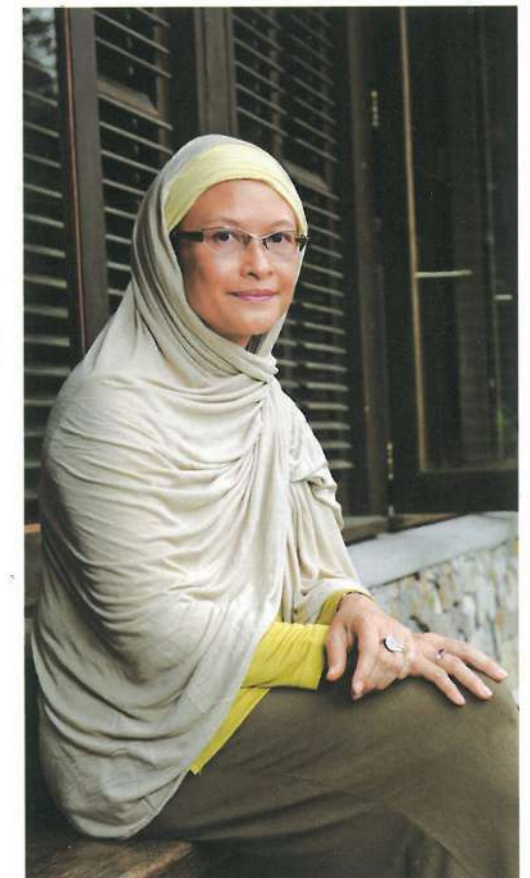
Puan Almaz Salma VII