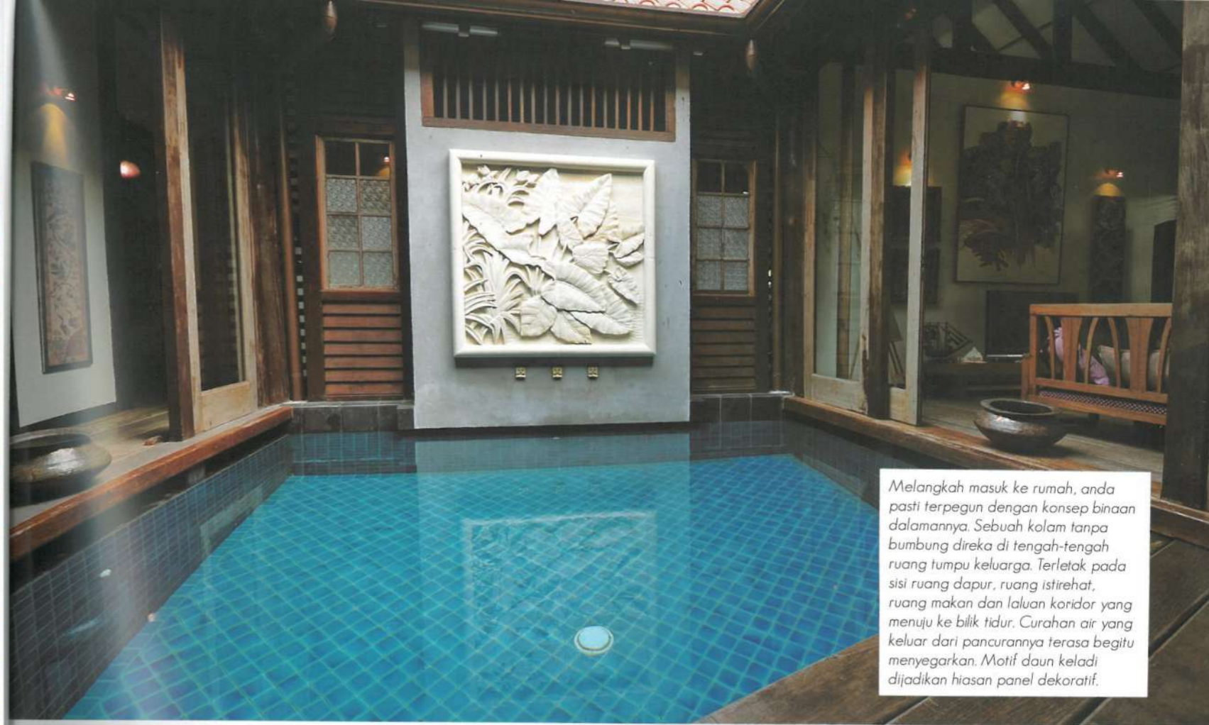
Melangkah masuk ke rumah, anda pasti terpegun dengan konsep binaan dalamnya. Sebuah kolam tanpa bumbung direka di tengah-tengah ruang tumpu keluarga. Terletak pada sisi ruang dapur, ruang istirahat, ruang makan dan laluan koridor yang menuju ke bilik tidur. Curahan air yang keluar dari pancurannya terasa begitu menyegarkan. Motif daun keladi dijadikan hiasan panel dekoratif.