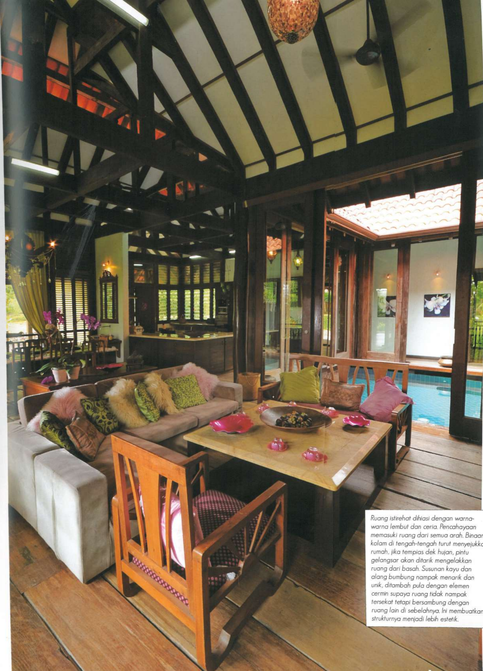
Ruang istirahat dihiasi dengan warna-warna lembut dan ceria. Pencahayaan memasuki ruang dari semua arah. Binaan kalam di tengah-tengah turut menyejukkan rumah, jika tempas dek hujan, pintu gelangsar akan ditarik mengelakkan ruang dari basah. Susunan kayu dan alang bumbung nampak menarik dan unik, ditambah pula dengan elemen cermin supaya ruang tidak nampak tersekat tetapi bersambung dengan ruang lain di sebelahnya. Ini membuatkan strukturnya menjadi lebih estetik.