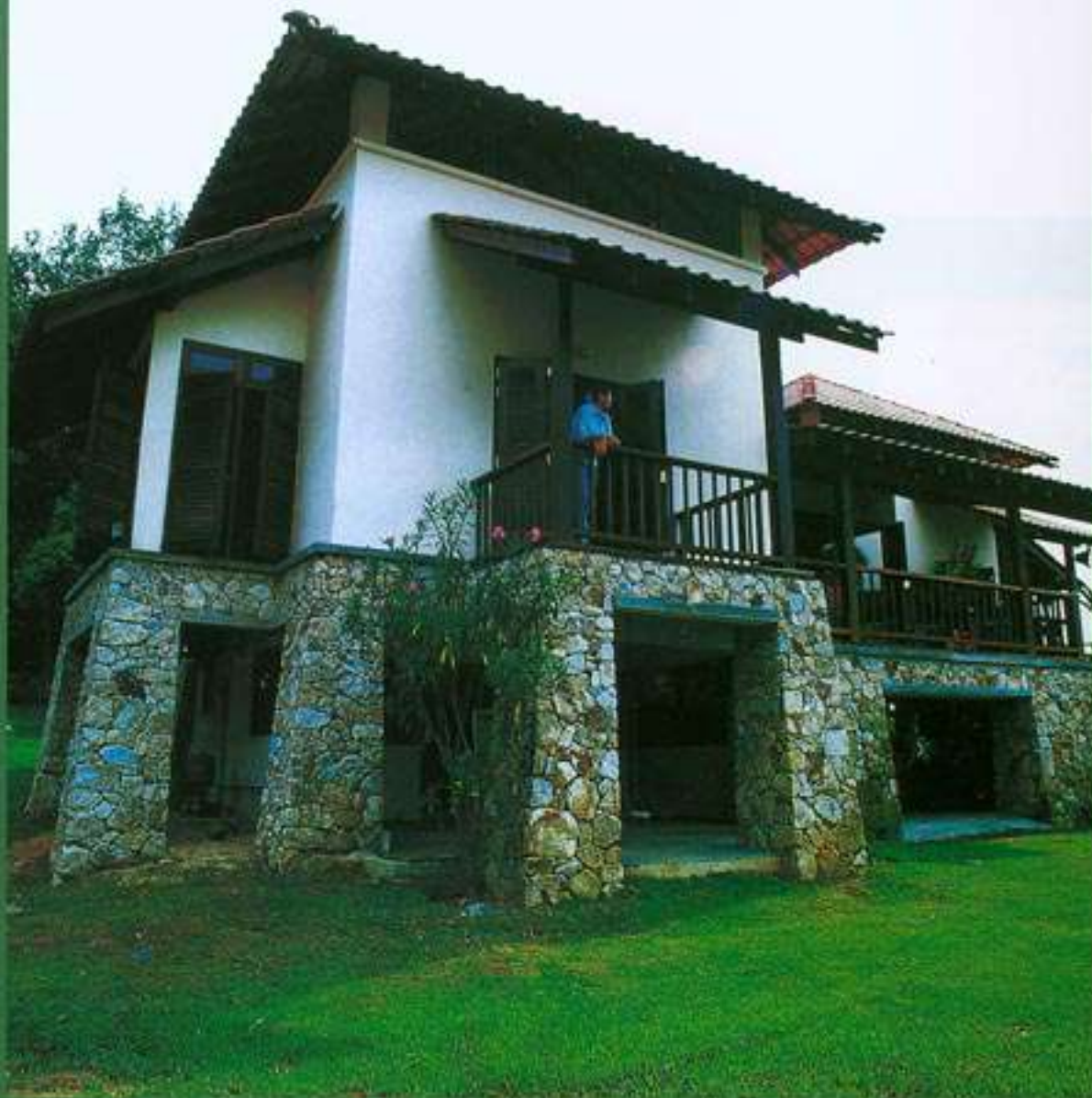
PENYELARAS & PENULIS: SAM ANUAR ZAINAL ABIDIN